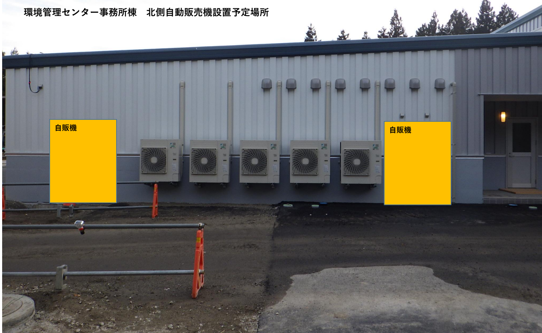
環境管理センター事務所棟 北側自動販売機設置予定場所