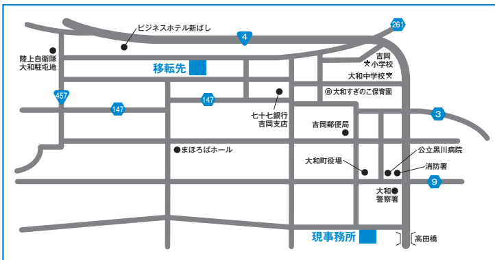
【移転先住所】大和町吉岡字下町15番地の1(旧仙台法務局大和出張所)