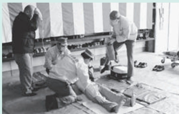
救命処置訓練の様子