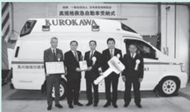
左から五味事務局長、財部委員長、赤間理事、若生理事、萩原理事