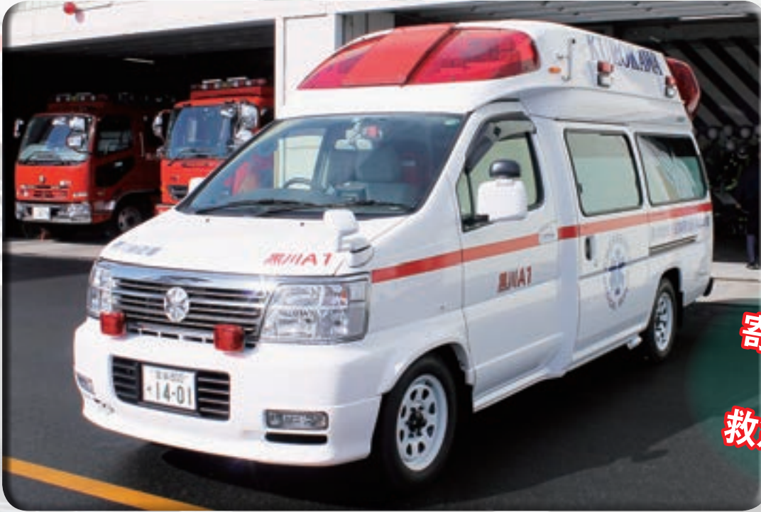
寄贈された 高規格 救急自動車