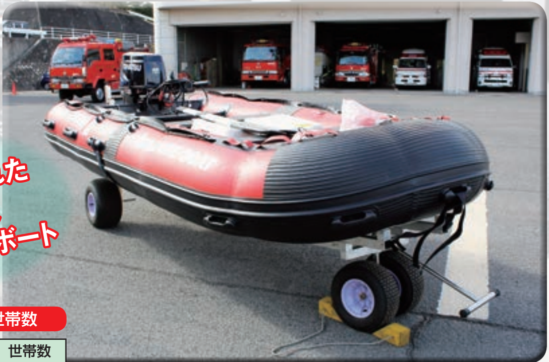
貸与された 硬質 ウレタンボート